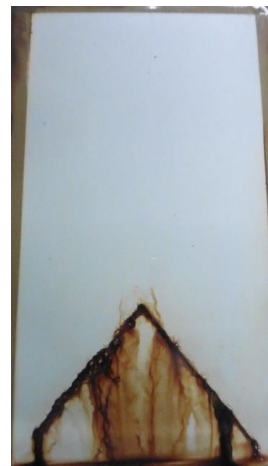
+2.5% ASCONIUM 143

注意：此為一指導性資料，並不具有約束力，我們建議使用者能在使用之前做有必要的測試，不要把它當做一種直接的替代品，如此才能確保產品適合於指定的應用。